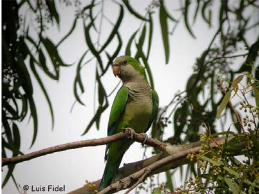
Myiopsitta monachus

siguiendo a Clements (2000). Se han añadido, además, las subespecies citadas cuando estas han sido determinadas.