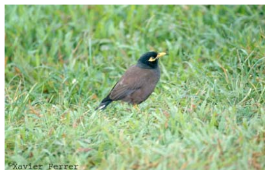
Acridotheres tristis

La distinción entre las categorías C y E depende de cada taxón en particular, aunque el GAE ha establecido un protocolo para asignar las especies a una u otra (Tabla 2). En caso de duda, debe mantenerse la categoría E hasta que existan pruebas para incluirla en la C.