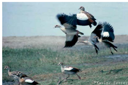
Alopochen aegyptiaca

En esta segunda versión de la lista, se incluyen los territorios norteafricanos de Ceuta y Melilla, mientras que han sido retiradas tres especies que solamente habían sido citadas en Gibraltar ( Daption capense , Junco hyemalis y Zonotrichia albicollis ). Estos cambios se han llevado a cabo para adecuar el ámbito de trabajo del GAE al de la nueva lista de las aves de España. Debido a la escasa información existente sobre aves exóticas en los territorios norteafricanos, de la que solamente conocemos la observación de Psittacula krameri , no se detallan por ahora las categorías que les corresponden en la tabla.