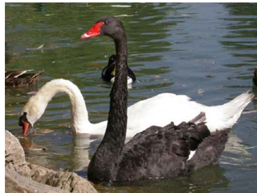
Cygnus atratus & C. olor

Cualquier tipo de información sobre especies invasoras en nuestro país puede enviarse a: exoticas@seo.org .